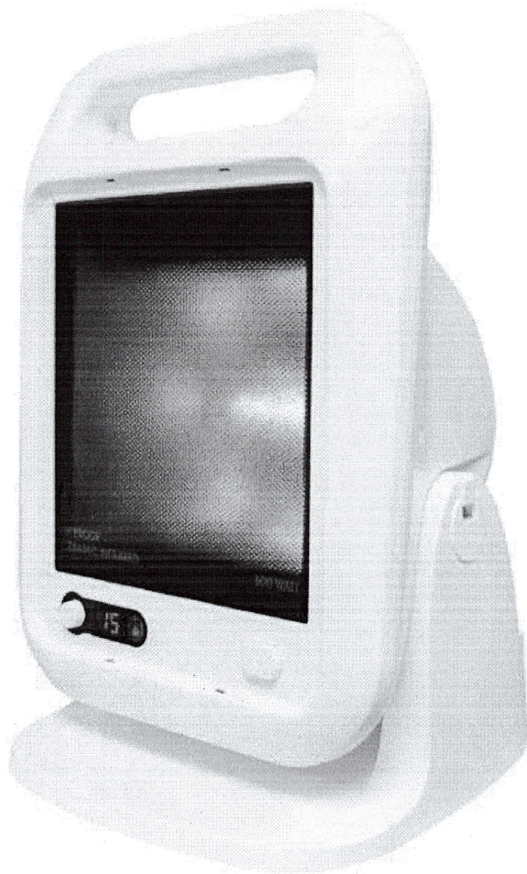
SYMPLEE AK-2012-R 300W